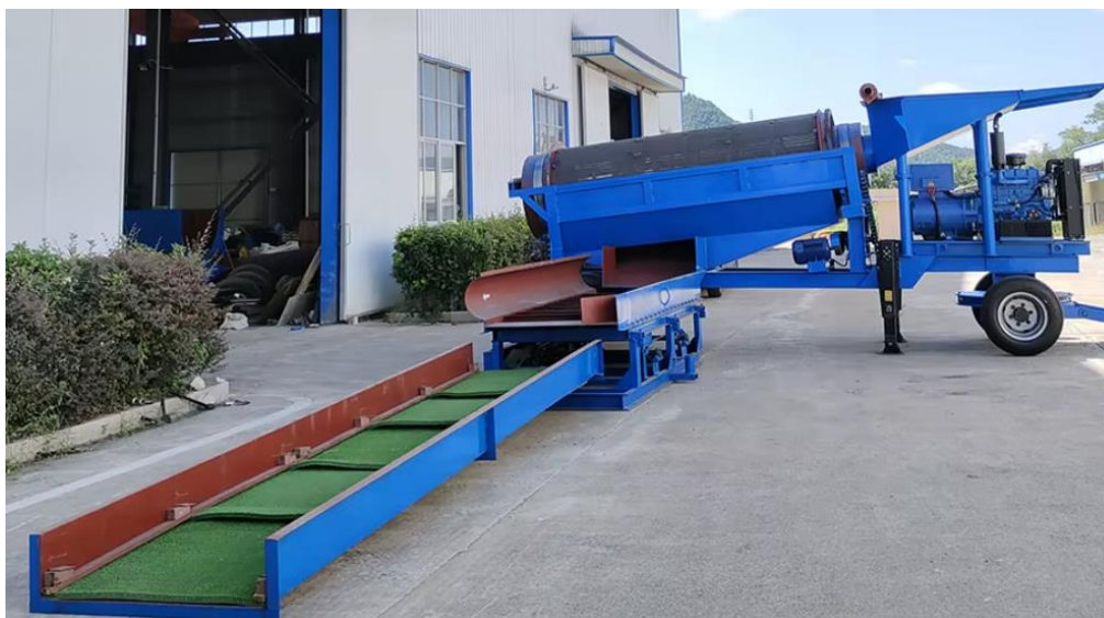
Trómel y canaleta (planta móvil)

Para mineras aluviales o de sedimentos, se puede usar una planta de lavado que incluye un tambor rotatorio (trommel), zarandas o cribas, seguido de cajas de lavado (sluice boxes) o mesas gravimétricas. Estas plantas permiten lavar, clasificar y concentrar el mineral con agua, separación física de arenas y grava, y recuperación del oro.