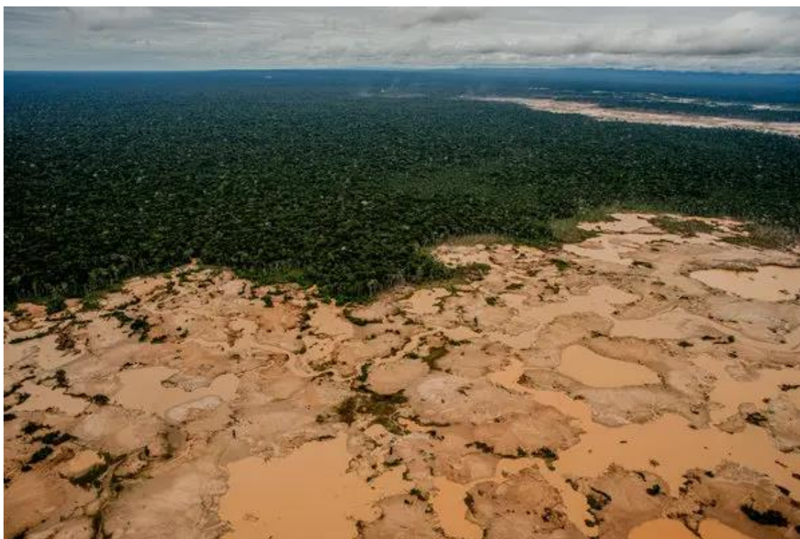
Consecuencias de la minería ilegal

El primero y más conocido es la contaminación por mercurio . Durante décadas, este metal ha sido utilizado para amalgamar el oro debido a su bajo costo y facilidad de uso. El problema surge porque gran parte del mercurio utilizado se libera directamente al ambiente: al agua, al suelo y a la atmósfera. El mercurio elemental puede transformarse en metilmercurio , una forma altamente tóxica que se bioacumula en peces y organismos acuáticos, afectando a la fauna, a los ecosistemas y a la salud humana. Este es uno de los impactos más graves, especialmente en zonas donde la pesca es fuente de alimento. La exposición crónica al metilmercurio puede causar daño neurológico, problemas cognitivos, afectación al desarrollo infantil y enfermedades renales.