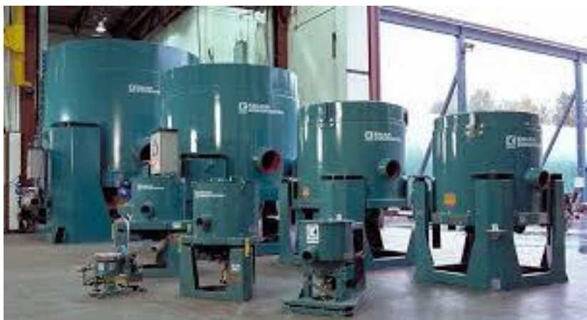
Concentradores centrífugos "Knelson"

Para partículas finas de oro, difíciles de separar con métodos tradicionales de gravedad, existen equipos centrífugos especializados. Un ejemplo es el Knelson concentrador - un concentrador centrífugo que, mediante fuerza de centrifugado, separa partículas de oro libre que de otro modo podrían perderse.